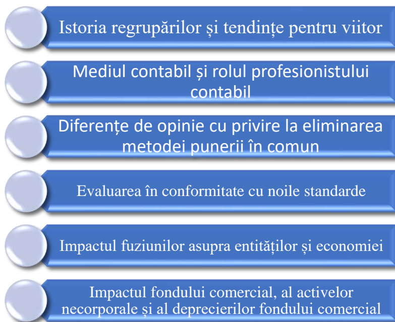
Figura 1. Paliere pentru cercetarea fuziunilor

Importanța fuziunilor, în ceea ce privește cercetarea, se referă la dezvoltarea standardelor de contabilitate și finanțe pentru raportarea financiară și la impactul standardului asupra economiei. Pentru o cercetare completă și complexă, se impune o analiză pe mai multe paliere: